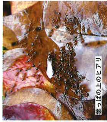
葉っぱの上のヒアリ

アリに刺された旨を伝えて受診してください。 ヒアリの毒への反応は、人によって大きく異なります。